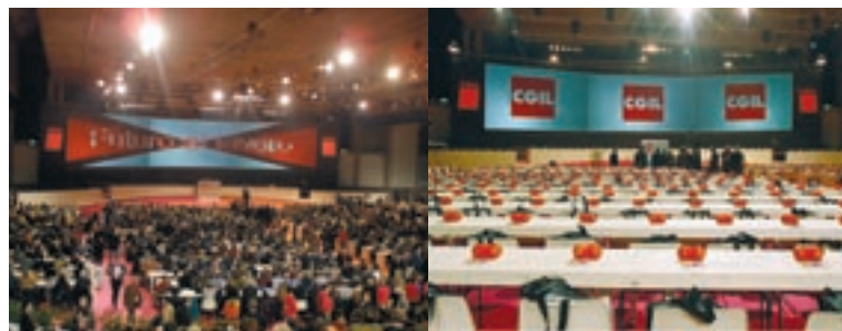
Febbraio 2002. Il Palacongressi di Rimini ospita il Congresso della CGIL.