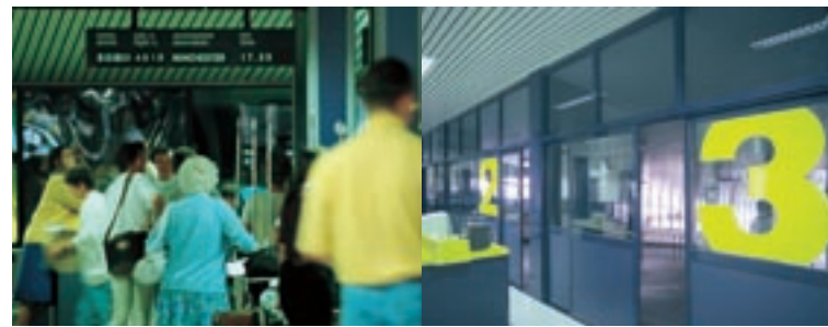
La moderna aerostazione dell'Aeroporto Internazionale di Rimini.