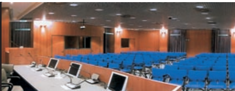
La nuova sala SGR della Società Gas Rimini: ingresso indipendente e un auditorium per 180 persone.