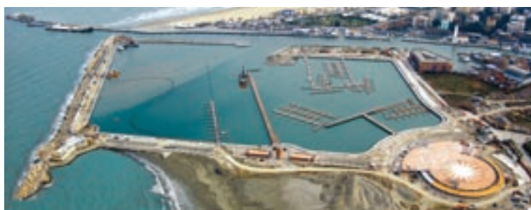
In questa veduta aerea, tutta l'ampiezza e la modernità della nuova darsena