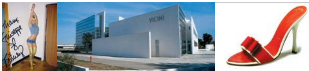
Una foto con dedica di Britney Spears, che indossa stivali Vicini. Accanto, la modernissima sede e un modello della nuova collezione.