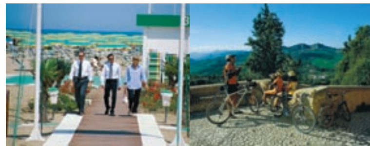
Idee per il post-congresso nella Riviera di Romagna, fra la spiaggia e le colline.