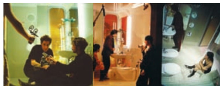
Scene della performance dei Motus: Rooms, che sarà presentata a Santarcangelo dei Teatri.