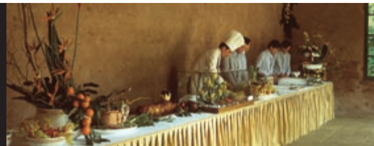
Un buffet "tipico" di Summertrade. Insieme a Catering & Banqueting, la tradizione gastronomica arriva sulla tavola dei congressi.