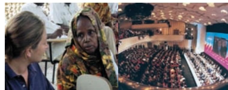
Un'immagine della giornalista Ilaria Alpi, uccisa in Somalia. E la affollata platea delle Giornate del Centro Pio Manzù.