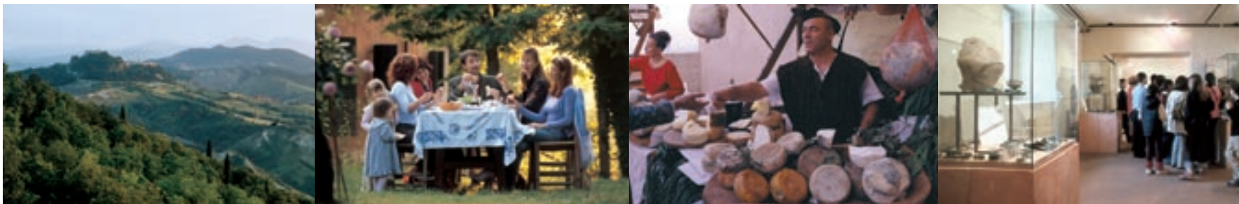
A cavallo fra la Romagna e le Marche, alle spalle di Rimini, un territorio ricco di proposte: passeggiate nella natura, cucina e prodotti tipici, musei e atmosfera.