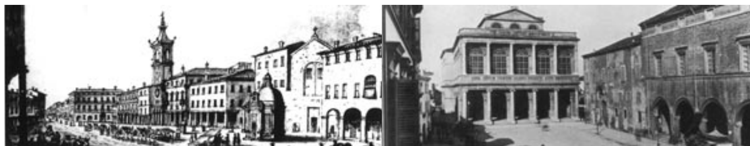
"Veduta della piazza della città di Rimini detta di S. Antonio" disegno a penna e acquerello di Pio Panfili (1790). A destra, una fotografia di piazza Cavour alla fine dell'Ottocento.