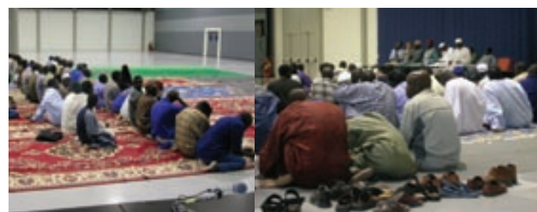
L'associazione senegalese Cheick Ahmadou Bamba nell'Auditorium del Palacongressi di Rimini.