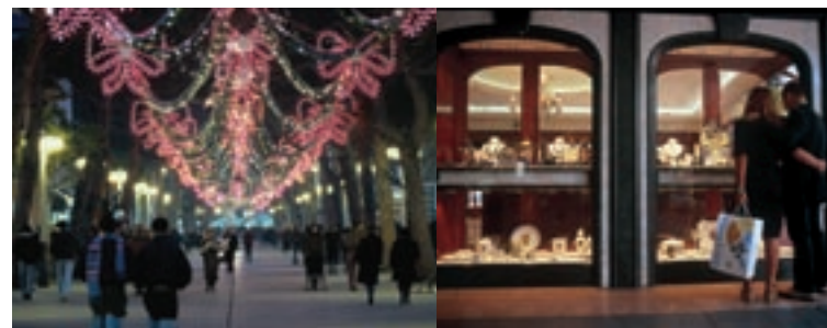
Viale Ceccarini, il salotto di Riccione, illuminato a festa, con il particolare di una vetrina.