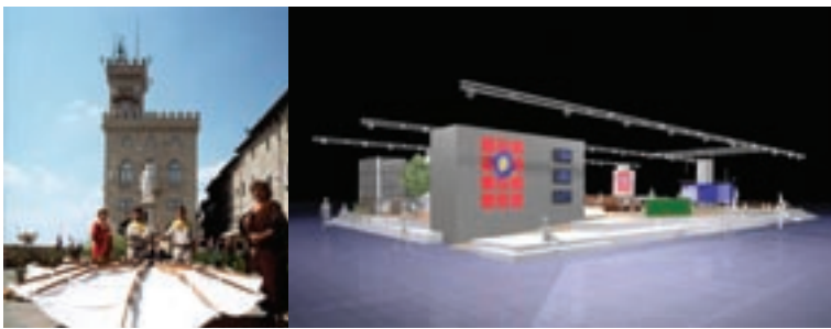
Due eventi curati da Evo Team: a sinistra, nell'atmosfera medioevale di San Marino. A fianco, l'allestimento di una convention.