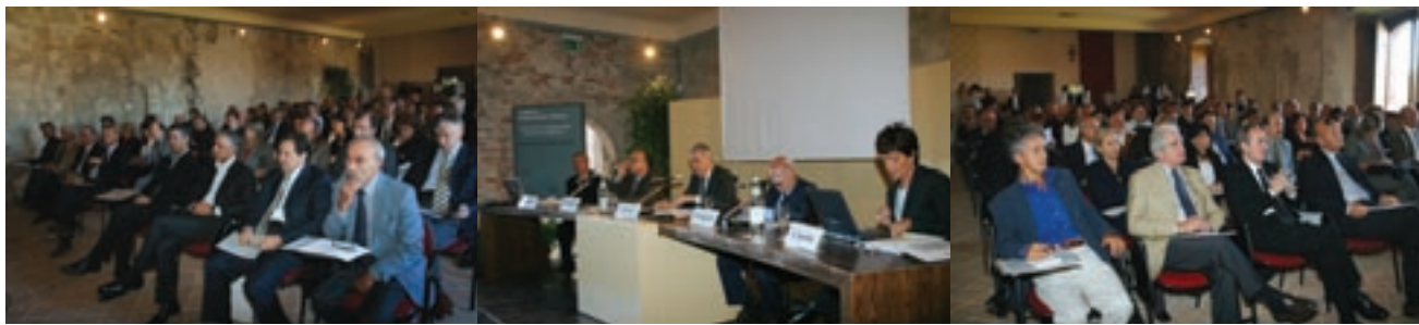
La presentazione delle ricerche sul sistema congressuale riminese, nelle sale di Castel Sismondo.