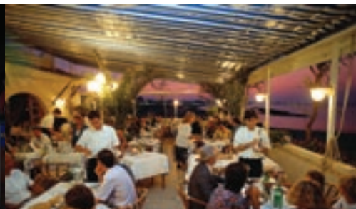
La tipica rustida a base di pesce appena pescato cotto alla brace. È una degustazione di prodotti del territorio.