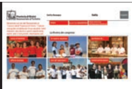
Il sito web della Provincia di Rimini, con le informazioni turistiche, e l'arco di ingresso al Borgo di Montegrolfo.