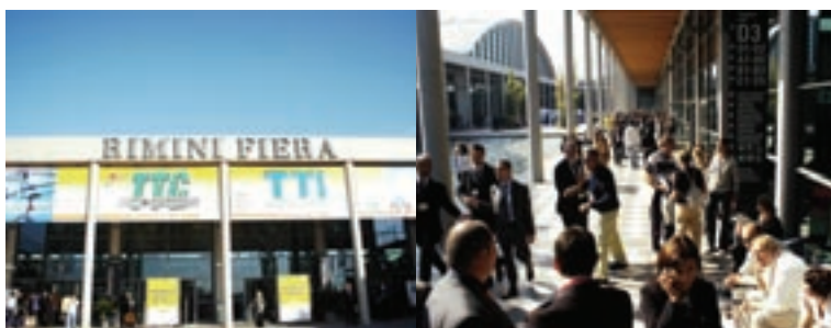
Il Nuovo Quartiere Fieristico durante la 40a edizione di TTG Italia, per la prima volta a Rimini.