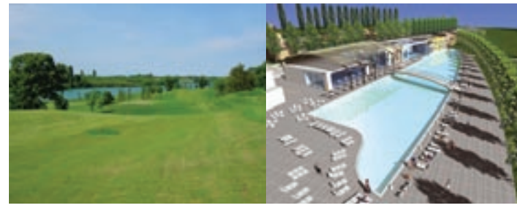
Un'immagine del campo da golf a 18 buche e, a destra, il progetto della piscina da 85 metri.