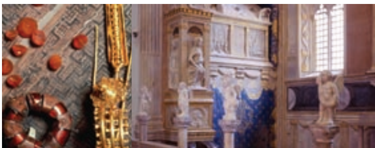
Preziosi monili villanoviani conservati al Museo di Verucchio. A fianco, interno del Tempio Malatestiano di Rimini.