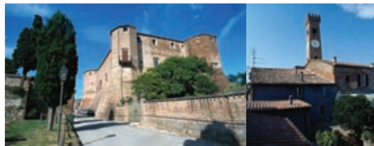
L'entroterra riminese: Santarcangelo di Romagna, con la Rocca malatestiana e la torre dell'orologio detta il "campanone".