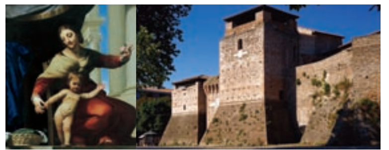
Una delle opere esposte e, accanto, Castel Sismondo.