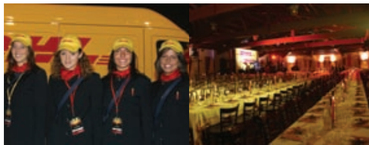
Due immagini della convention DHL ospitata al Palacongressi di Rimini nel 2003.