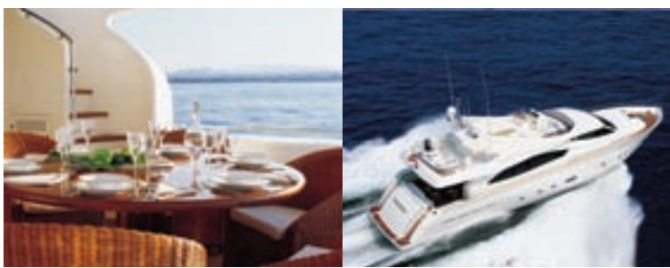
Il nuovo yacht Ferretti 880, che parteciperà alla tre giorni riminese.