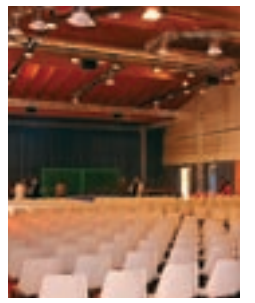
Il Palaterme di Riccione.