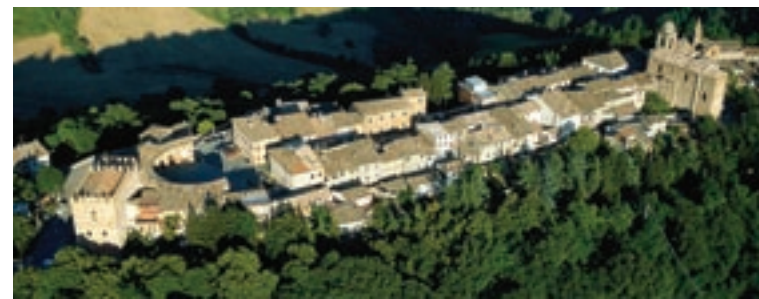
I tesori dell'entroterra riminese: una veduta aerea di Mondaino.