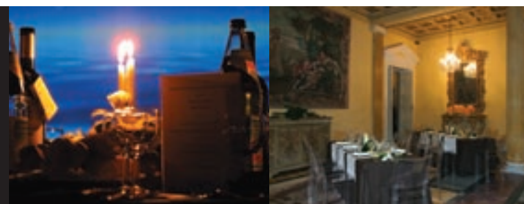
A sinistra, mise en place per la cena di una finanziaria. A fianco, banchetto a Villa des Vergers.