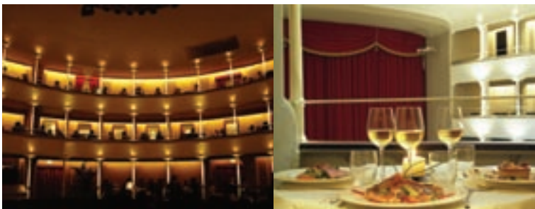
Il Teatro Verdi di Cesena: la balconata e l'allestimento per cena in un palco.