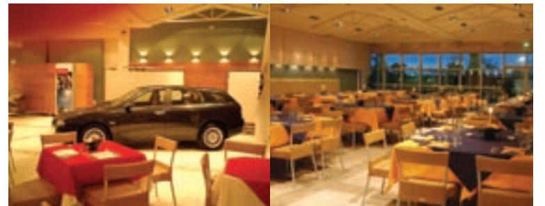
Due immagini del nuovo ristorante. A sinistra, in occasione di una convention.