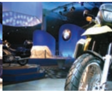
Immagine della convention BMW al Palacongressi di Rimini.