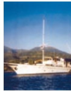
La barca d'epoca Contessa d'Azur nella Marina di Rimini.