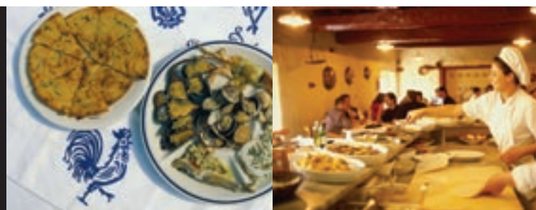
Piatti tipici riminesi, il nuovo trend nella ristorazione di qualità della Riviera di Romagna.