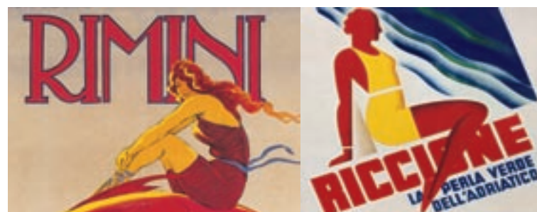
Particolari di celebri manifesti dei primi decenni del secolo, opera dei cartellonisti Marcello Dudovich e Mario Puppo.