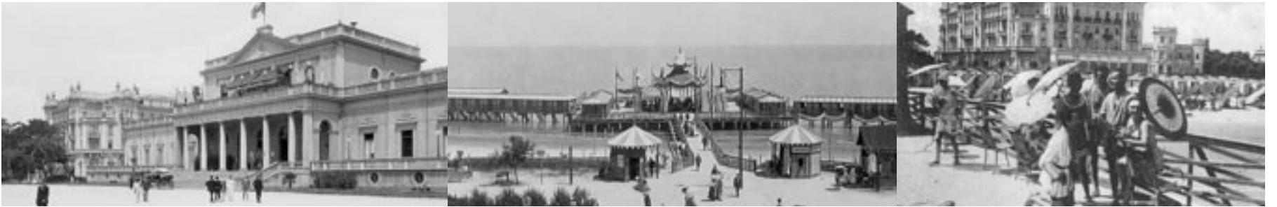
Il Kursaal e il primo stabilimento balneare di Rimini inaugurato centosessanta anni fa. Accanto, in una cartolina d'epoca del 1927, bagnanti sulla piattaforma con il Grand Hotel di Rimini sullo sfondo.