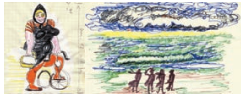
Due dei numerosissimi disegni di Federico Fellini che saranno esposti nel nuovo Museo di Rimini a lui dedicato.