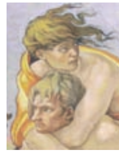
Mostra del Meeting sulla Cappella Sistina. Particolare.