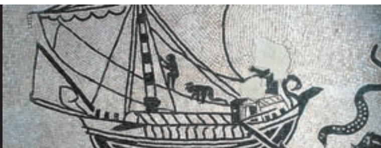
Particolare di un mosaico romano conservato nel nuovo Museo Archeologico di Rimini.