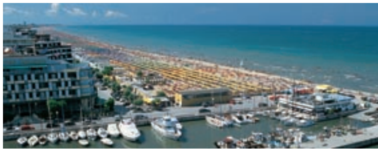
A Riccione (nella foto) oltre 60 hotel fanno parte da sei anni di un circuito per il rispetto dell'ambiente.