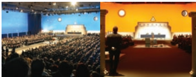
Due immagini del meeting del Grand'Oriente, ospitato nell'aprile 2003 dal Palacongressi di Rimini.