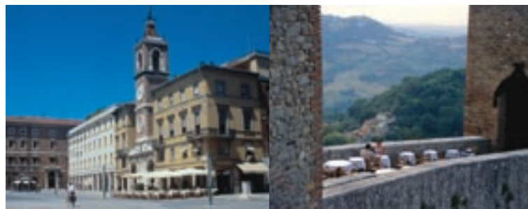
La Torre dell'Orologio, in piazza Tre Martiri a Rimini. E uno dei molti ristoranti dell'entroterra.